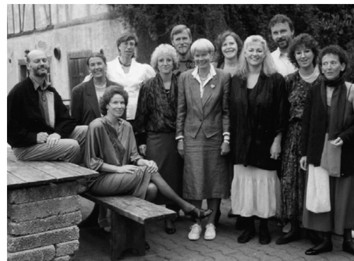
Alte Zeiten I