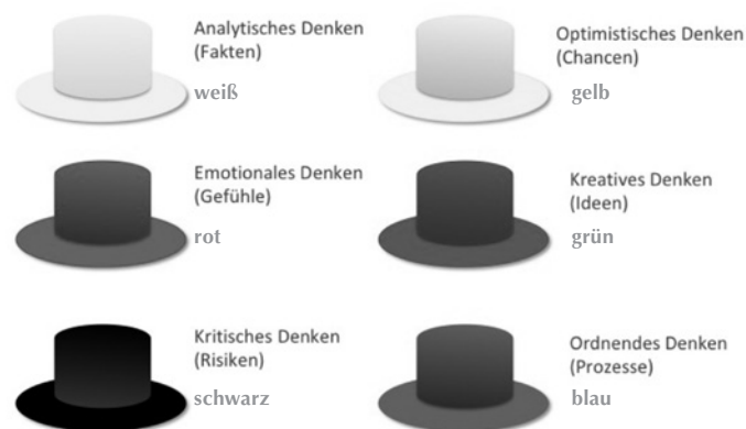
Abbildung 2: Die sechs Denkhüte nach De Bono

Blau – Der blaue Hut steht für ordnendes Denken. Im Mittelpunkt steht der Überblick über den gesamten Prozess und dessen Steuerung. Durch eine Draufsicht werden nächste Schritte erarbeitet, ein Regelwerk, das diese steuert, und Instanzen zur Überwachung. Wo stehen wir gerade? Welche nächsten Schritte sind zu gehen? Woran kann der Fortschritt erkannt werden?