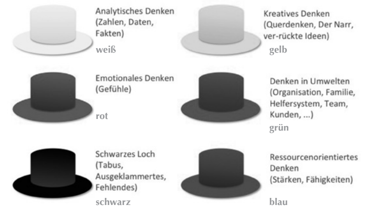
Abbildung 3: Abwandlung der Denkhüte

Die Beobachtungshüte können sich auch in Form eines Reflektierenden Teams austauschen. Wenn das Team diese Methode noch nicht kennt, kann die Supervisorin zunächst als Teil des Reflecting Teams die dortige Gesprächskultur ermöglichen.